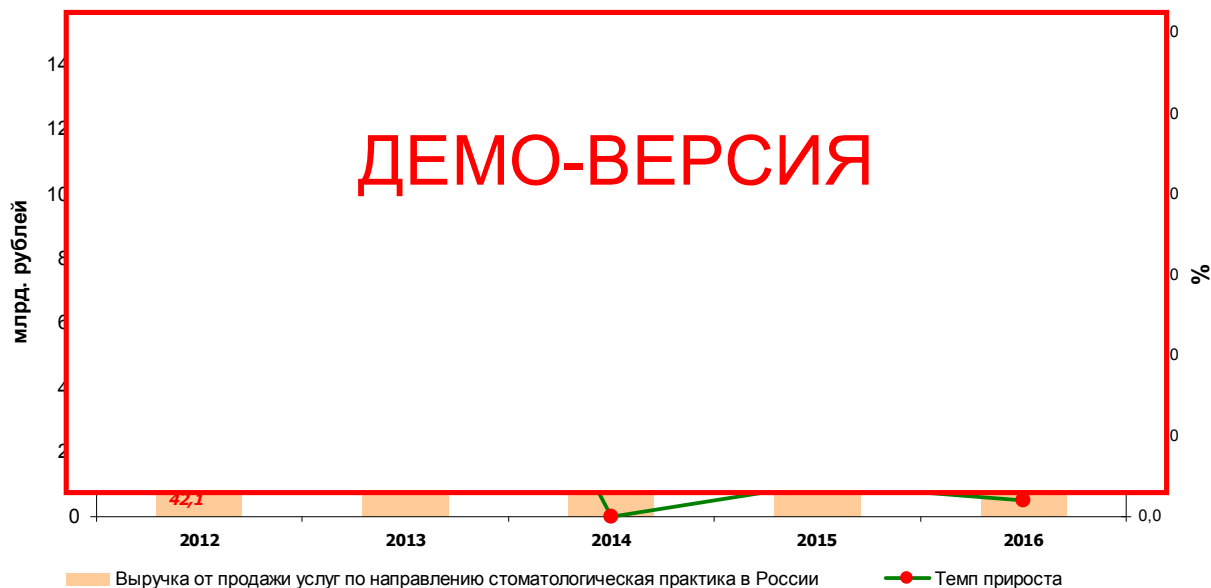
Диаграмма 2. Объем продаж стоматологических услуг в России в 2012-2016 гг.

Динамика объема выручки от оказания стоматологических услуг в России в 2012-2016 гг. представлена на диаграмме 2.