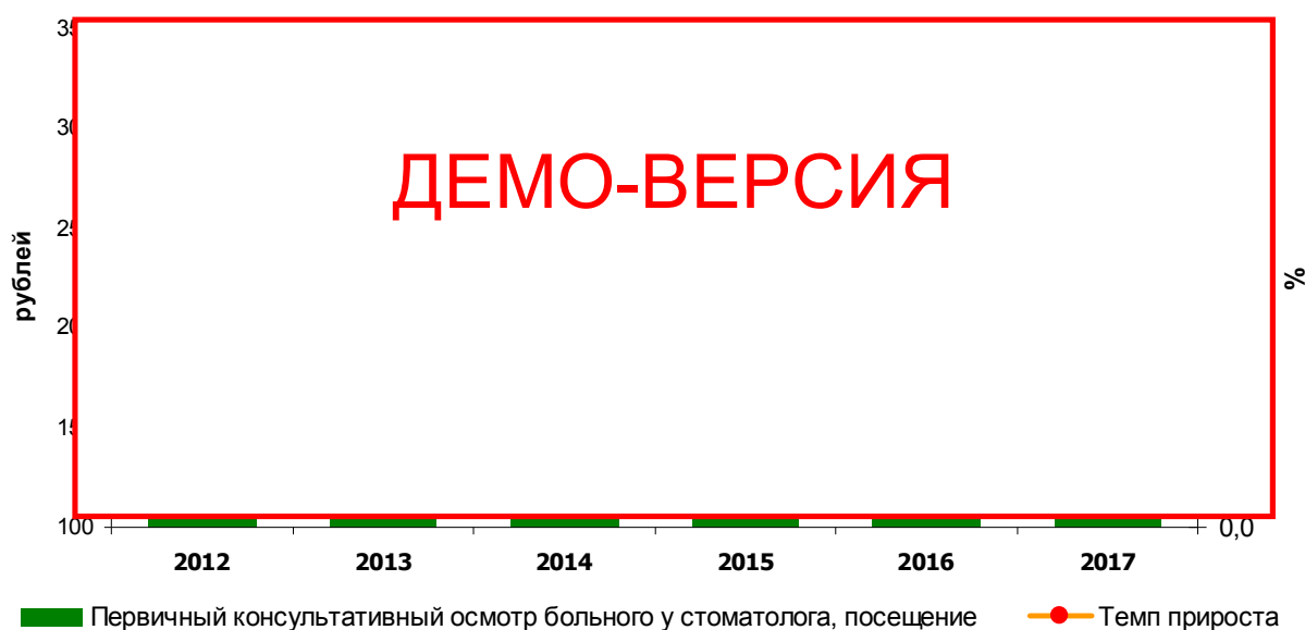
Диаграмма 11. Средняя цена на первичный консультативный осмотр у стоматолога в России в 2012-2017 гг.

Динамика средней цены на первичный консультативный осмотр стоматолога в России в 2012-2017 гг. приведена на диаграмме 11.