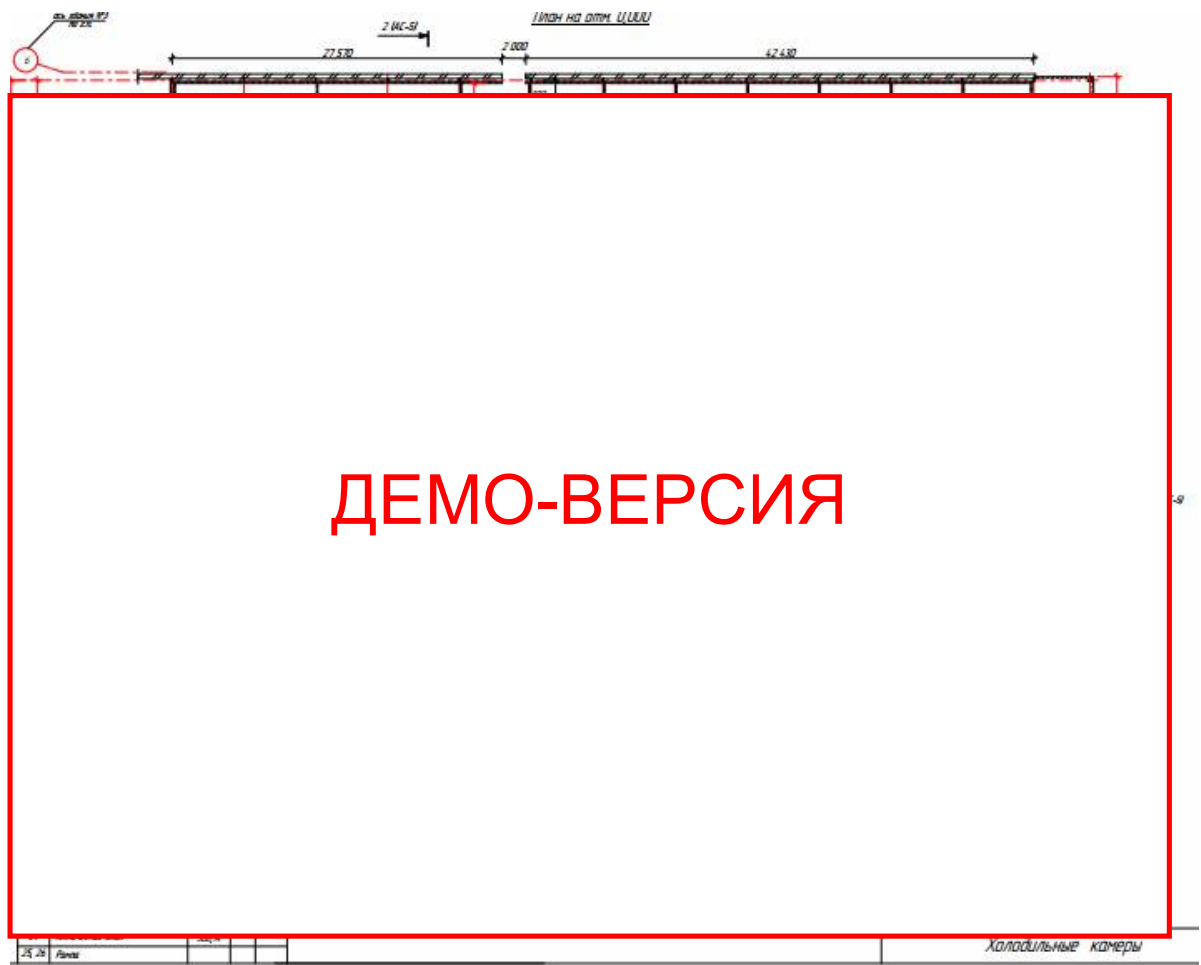
Рисунок 1. Экспликация помещений холодильного склада для фруктов

Таким образом, в составе фруктохранилища будет *** холодильных камер с регулируемой газовой средой вместимостью *** тонн каждая для хранения груш и яблок и *** холодильные камеры с искусственным охлаждением вместимостью *** тонн каждая для хранения яблок. Схема размещения камер на одном холодильном складе приведена на рисунке 1.