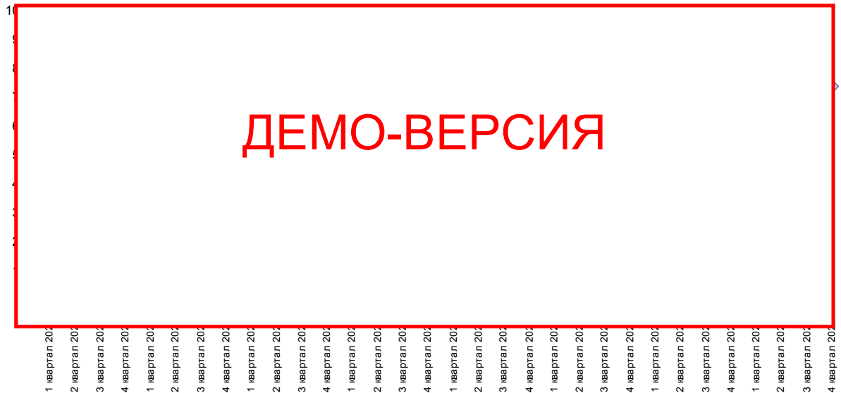
Диаграмма 2. График выручки, тыс. руб.

Отчет о прибыли (приложение 8) отражает операционную деятельность по проекту в определенные кварталы. График выручки приведен на диаграмме ниже.