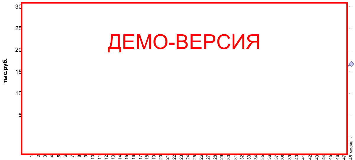
Диаграмма 11. График выручки кофейни

Отчет о прибыли (приложение 6) отражает операционную деятельность по проекту в определенные месяцы. График выручки приведен на диаграмме ниже.