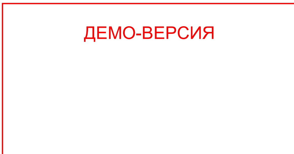
Диаграмма 1. Структура затрат предприятия по приему лома цветных металлов

Структура годовых затрат представлена на диаграмме 1.