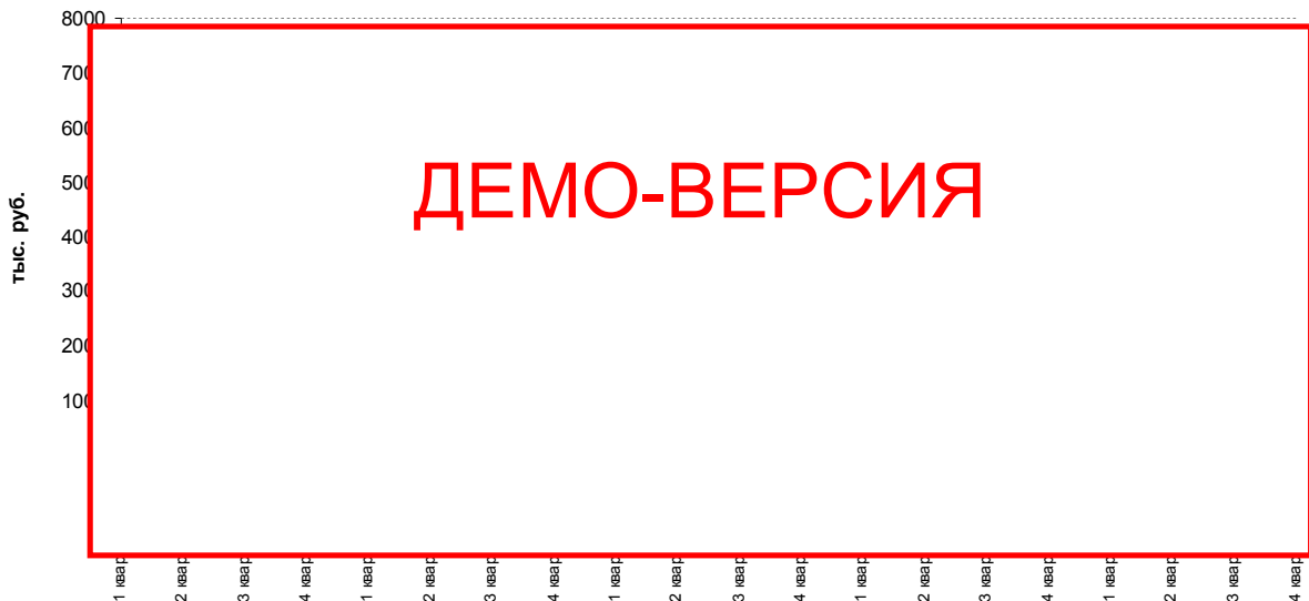
Диаграмма 2. График выручки фитнес-клуба

Отчет о прибыли (приложение 7) отражает операционную деятельность по проекту по кварталам. График выручки приведен на диаграмме 2.