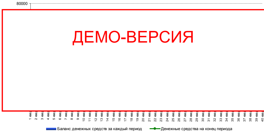
Диаграмма 3. Остаток денежных средств на счете в ходе реализации проекта, тыс. руб.

Финансовую состоятельность проекта подтверждает положительный остаток свободных денежных средств на протяжении всего горизонта рассмотрения. При заложенном в расчетах уровне доходов, текущих и инвестиционных затрат, проект необходимо признать как финансово состоятельный.