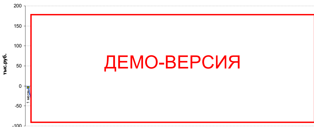
Диаграмма 3. График чистой прибыли

Из отчета о прибыли можно определить прибыльность ПВЗ. Так из приложения 3 и диаграммы ниже видно, что вследствие реализации проекта, ПВЗ начнет получать прибыль на *** месяце реализации проекта.