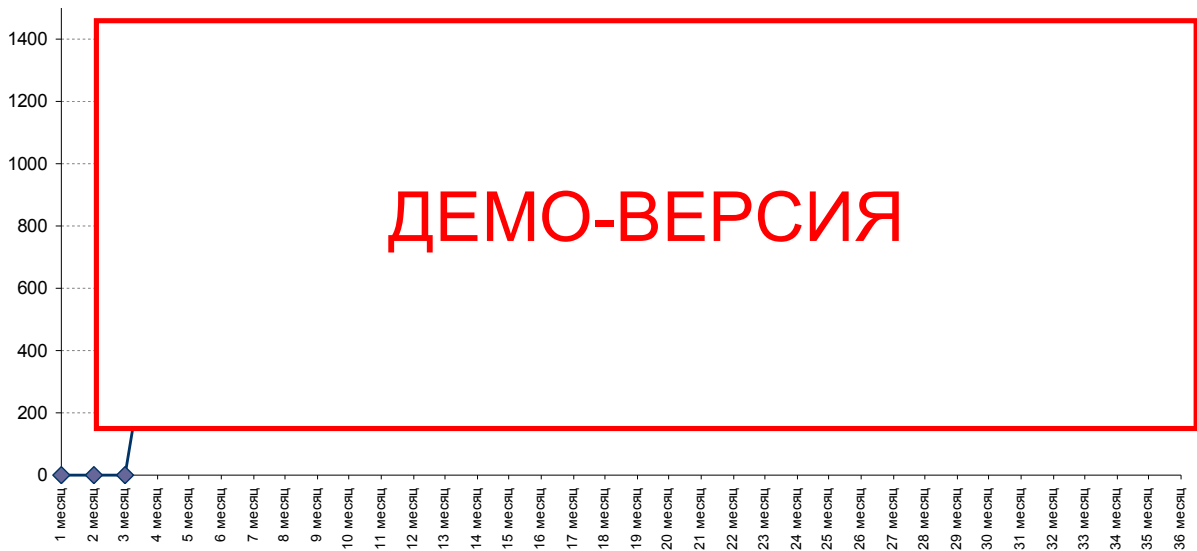
Диаграмма 2. График выручки, тыс. руб.

Отчет о прибыли (приложение 5) отражает операционную деятельность по проекту в определенные месяцы. График выручки приведен на диаграмме ниже.