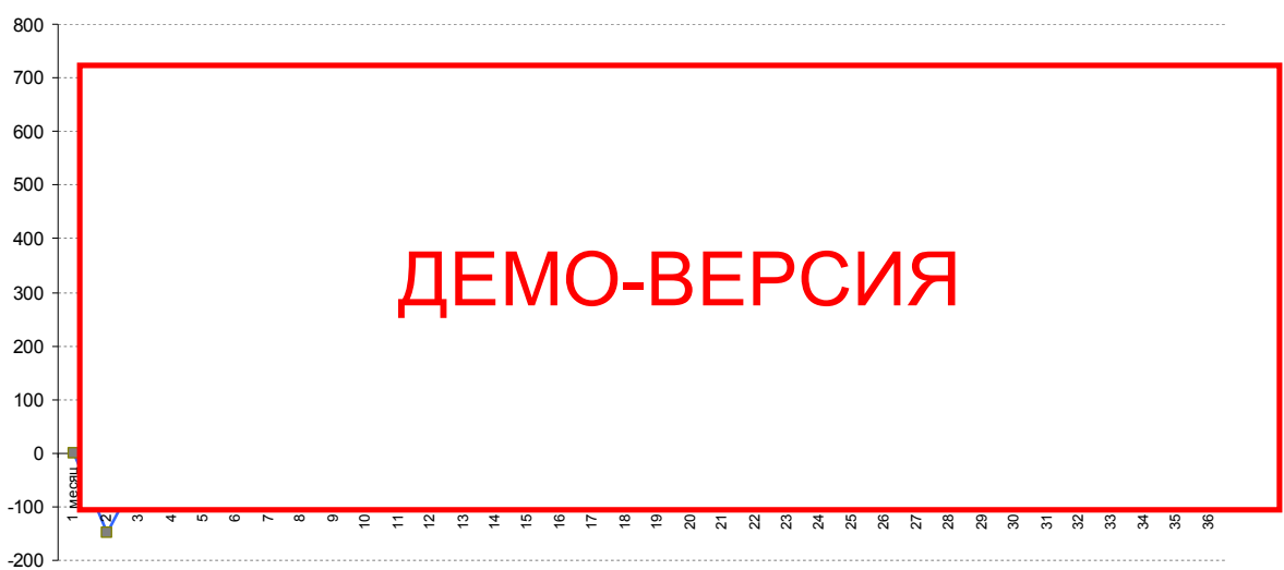
Диаграмма 3. График чистой прибыли, тыс. руб.

Из отчета о прибыли можно определить прибыльность предприятия, реализующего проект. Так из приложения 5 и диаграммы ниже видно, что вследствие реализации проекта бизнес начнет получать прибыль на 4 месяце реализации проекта.