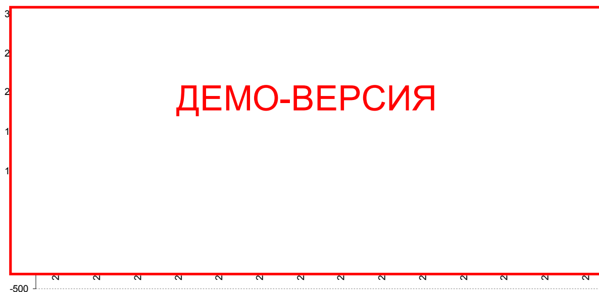
Диаграмма 3. График чистой прибыли

Из отчета о прибыли можно определить прибыльность предприятия, реализующего проект. Так из приложения 9 и диаграммы 3 видно, что вследствие реализации проекта свиноферма начнет получать прибыль на **** году реализации проекта.